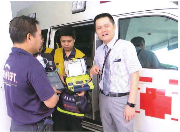
扶輪社友愛心捐AED救人命。

消防局指出，緊急就醫件數逐年增加，而部分失去呼吸心跳等生命徵象的病患，在救護人員施以心肺復甦術（CPR）及使用AED進行心臟電擊去顫等急救處置後救回一命，相信在民間的捐贈下，將能使更多病患受惠。