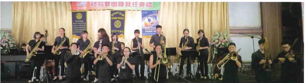
清水高中音樂班表演