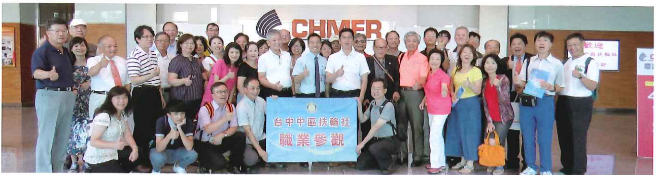
感謝董事長親自接待