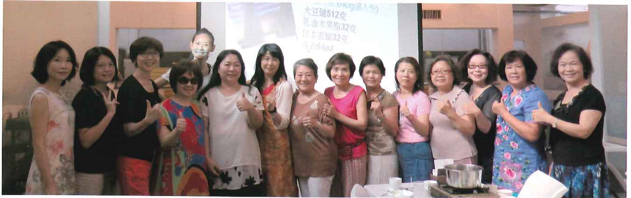
【第一次內輪會－DIY香氛蠟燭&紫雲膏】於7月29日下午，在基礎實驗bLAB舉辦。