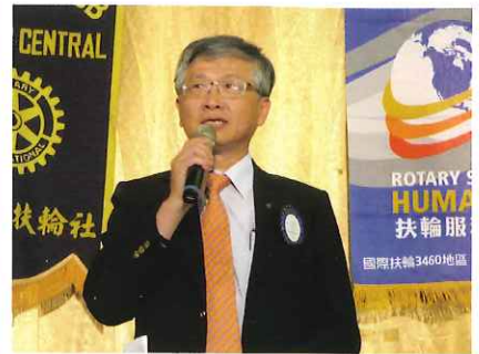
台中社社長當選人Patent致詞