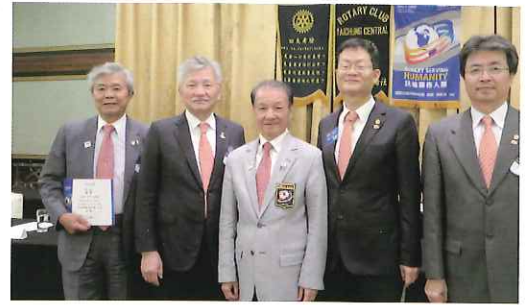
頒發總監團隊聘書