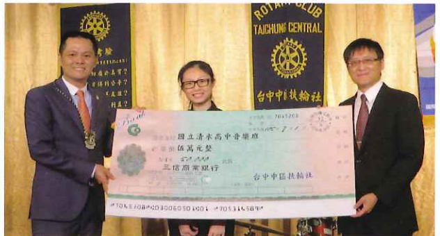
捐贈清水高中音樂班獎學金