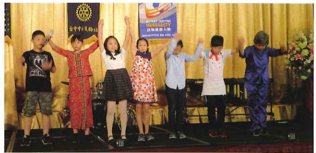
惠文國小星光劇團表演