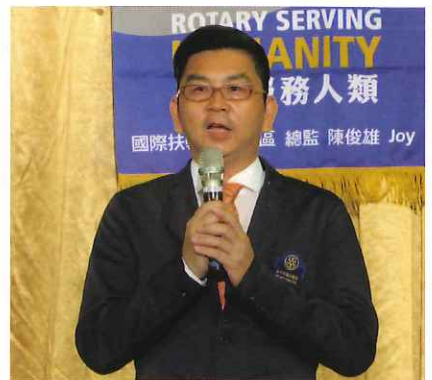
社長當選人Team致謝詞