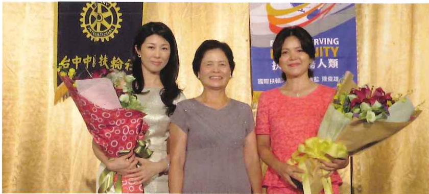
贈送社長夫人及秘書夫人花束