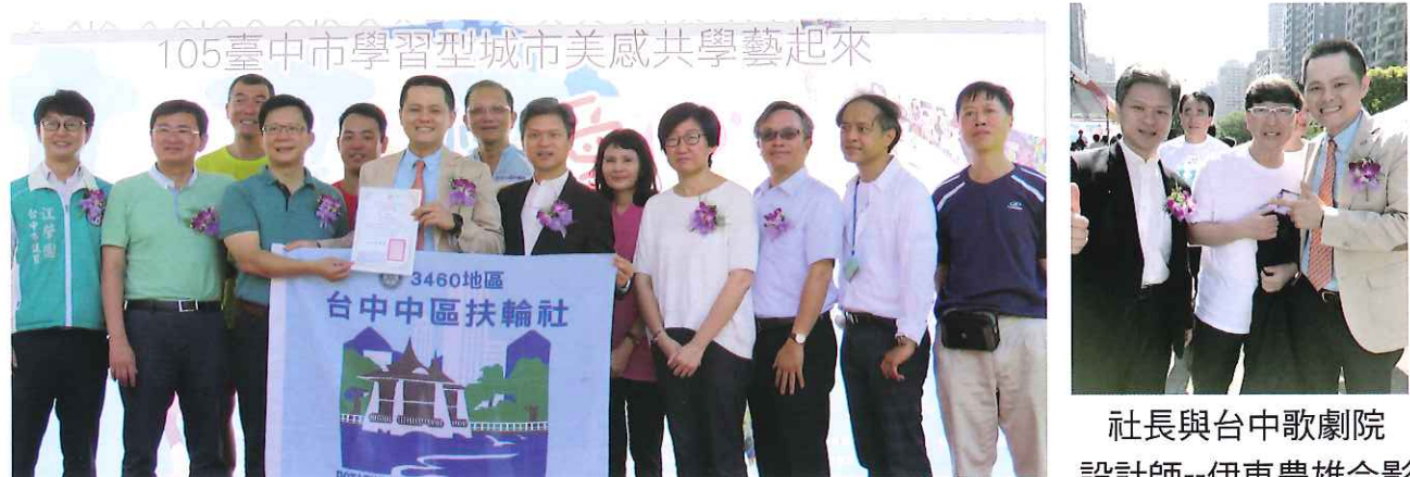
社長與台中歌劇院 設計師--伊東豐雄合影