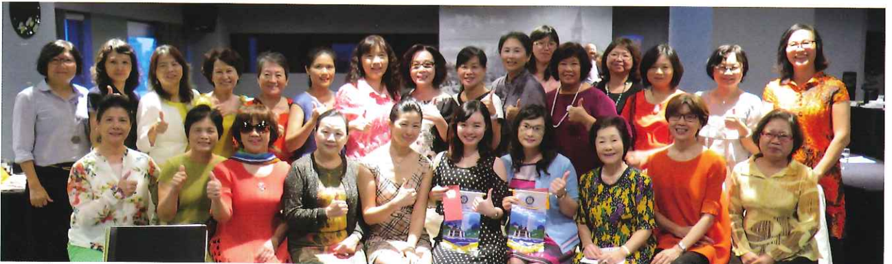
【第二次內輪會－跟著Melody進入歌唱的奇喚世界】於9月30日在金典酒店11樓舉辦