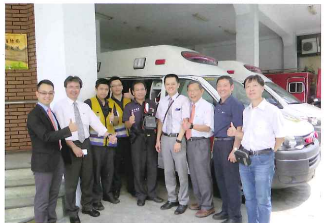
扶輪社友愛心捐AED救人命，後續前往南投縣消防局獲悉已救兩人。