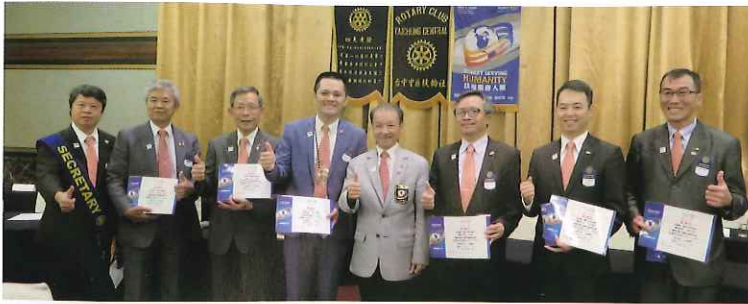
頒發保羅哈里斯之友感謝狀