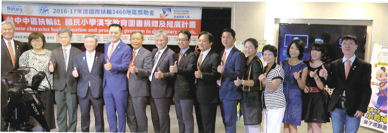
各媒體也熱烈報導本活動