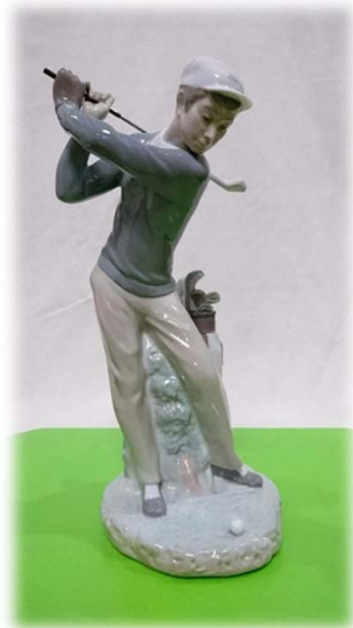
2017~2018年度 内輪会 グランドチャンピオントロフィー