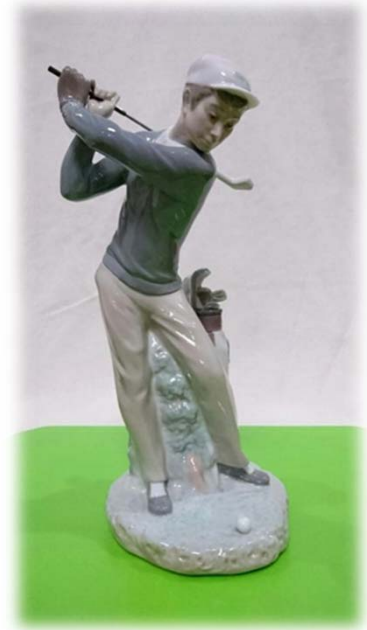
2017～2018年度 内輪会 グランドチャンピオントロフィー