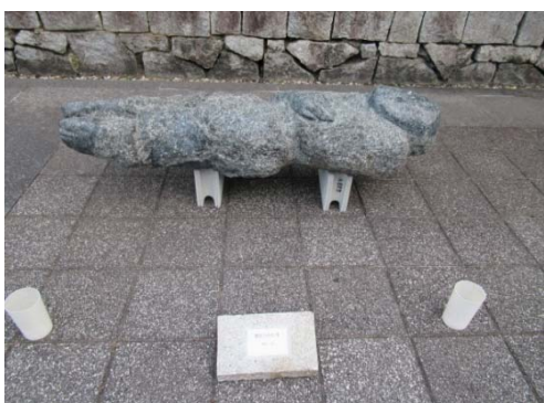
杉村 仁会員 作品