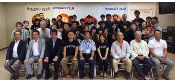
9月10日 奈良市防災センター 川野会員・ご家族 奥田会員・ご家族 参加