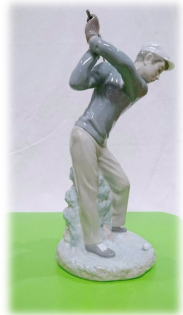
2017~2018年度 内輪会 グランドチャンピオントロフィー