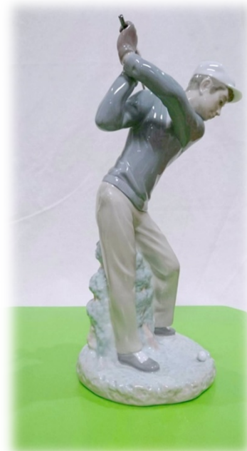
2017～2018年度 内輪会 グランドチャンピオントロフィー