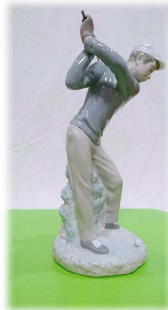
2017~2018年度 内輪会 グランドチャンピオントロフィー