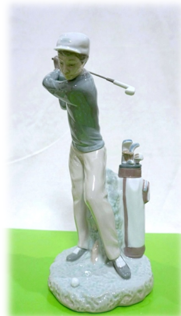
2017~2018年度 内輪会 グランドチャンピオントロフィー