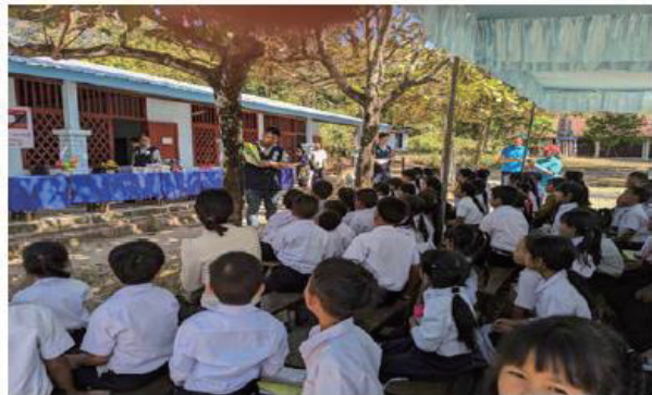
住血吸虫を体内から駆除剤する薬を飲んでもらいます。