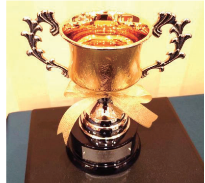
2023-24年度 内輪会トロフィー