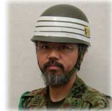
112日間のひげ (東日本大震災の当時)